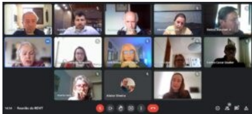
Figura 07: Reunião Mensal Grupo Revit. Data: 04.08.2021