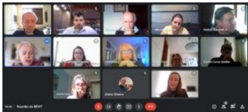
Figura 8: Reunião Mensal Grupo Revit. Data: 06.10.2021