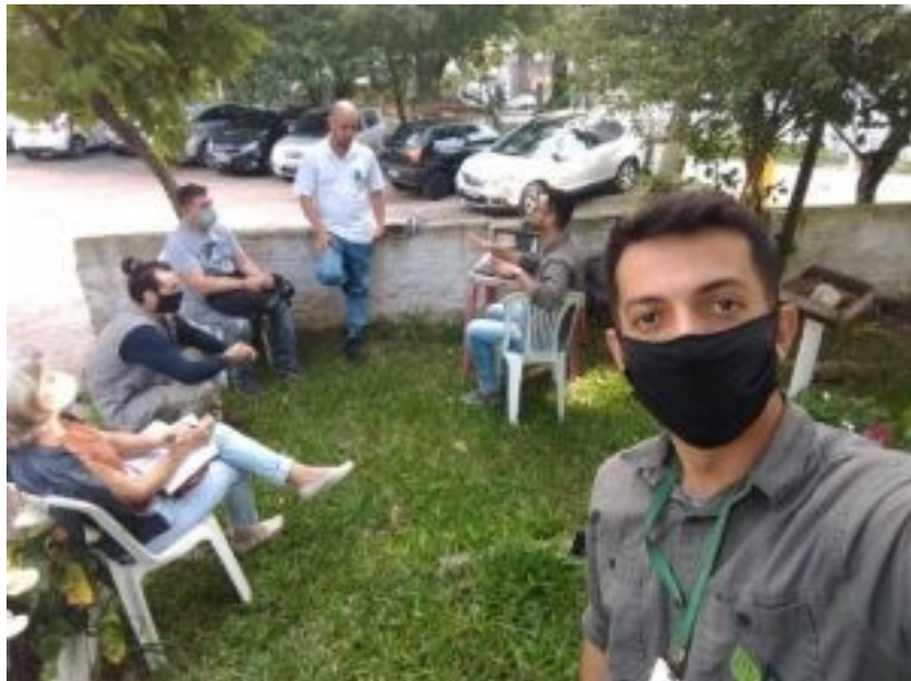
Figura 04: Reunião para Planejamento Estratégico das Ações no Parque da Luz. Data: 04.05.21.