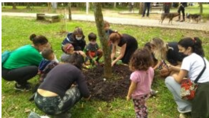
Figura 11: Evento plantio de Flores. Data: 23.10.2021.