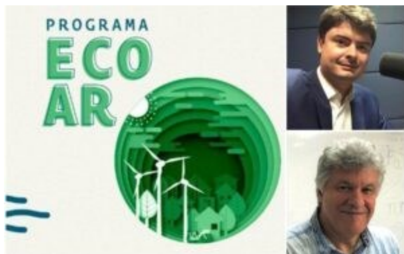
Figura 12: Programa Ecoar. Data: 21.10.21.