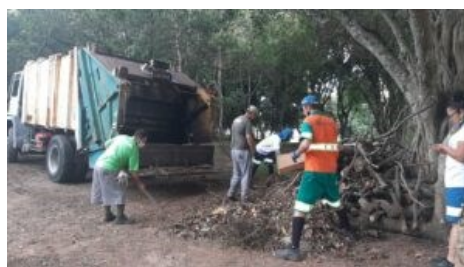
Figura 05: Ações e programas da Gestão Compartilhada