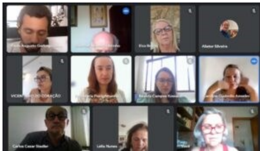
Figura 9: Reunião Mensal Grupo Revit. Data: 03.11.2021