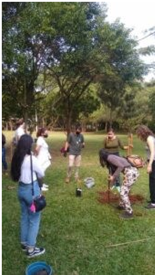
Figura 10: Evento de comemoração ao Dia Mundial do Meio Ambiente. Data: 05.06.2021.