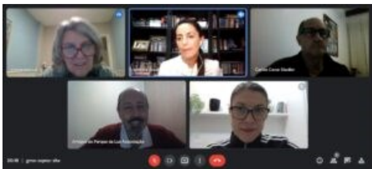
Figura 01: Reunião mensal da AAPLuz, de forma virtual. Data: 08.07.21