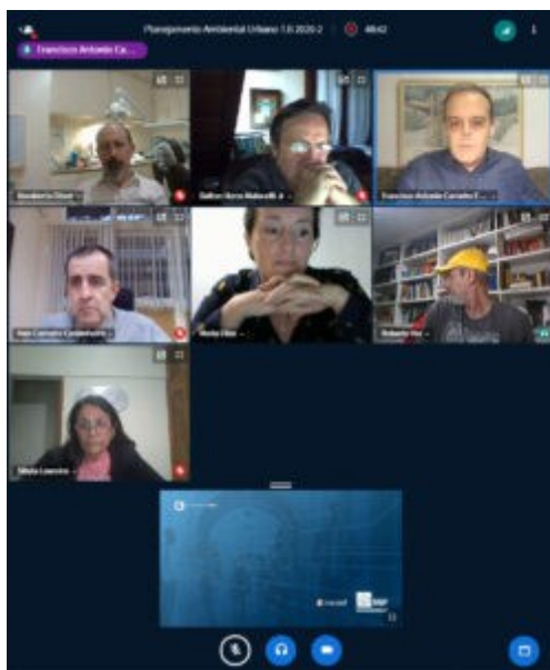
Figura 06: Seminário: saneamento ecológico