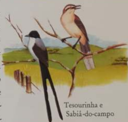
Tesourinha e Sabiá-do-campo